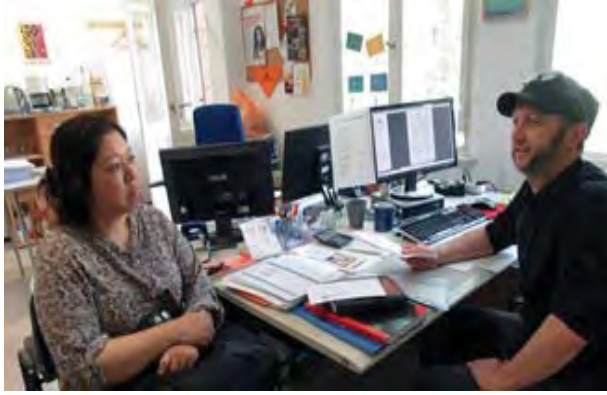
تقديم مشورة فردية حول سوق العمل مكتب بوتسدام